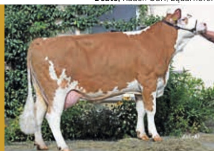
Deate, Rauch GbR, Equarhofen

geboren: 28.11.2011 Züchter: Klaus Wanner, Seinsheim-Wässerndorf Besitzer: Hohenzell, BVN, RBW