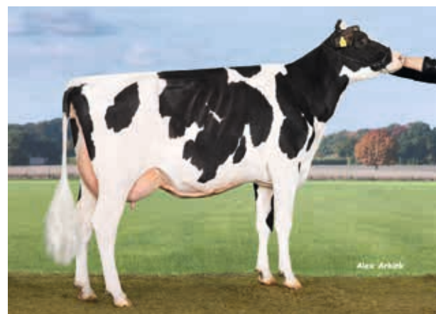
Hittje, Kessler GdbR, Dittlofsrode