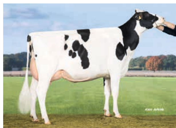
Kessa, Köhler GbR, Zimmersrode

→ Funktionelles Exterieur mit robotertauglichen Top-Eutern, färsentauglich, befruchtet gut