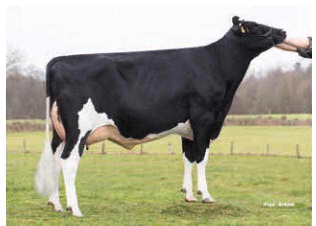
Ukarina, Gravert GbR, Lindau

→ Funktionelle Kühe, mit soliden, trockenem Fundamenten